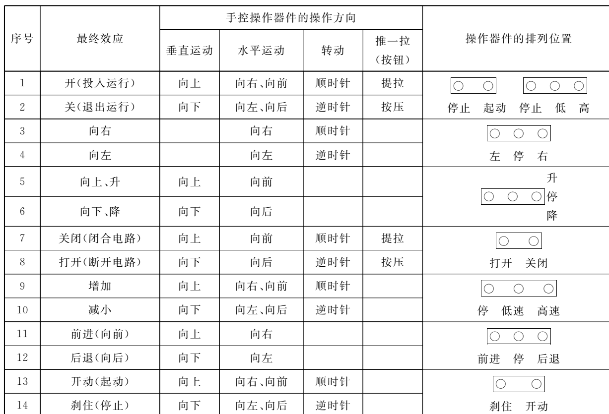
表 6 操作器件的操作和排列规则

应清楚地标明元件和器件的操作位置。操作方向宜按 GB/T 4205 的规定,见表 6。否则应清楚地标明该方向并在技术文件中说明。